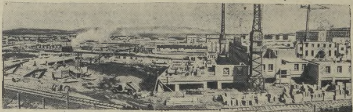
Красноярский край. Растет молодой заполярный город металлургов — Норильск. Там, где гудра, появляются новые кварталы жилых домов, учреждений, промышленных предприятий. Со всех концов страны сюда по призыву партии и правительства приезжают советские патриоты, чтобы личным трудом помочь быстрее освоить неисчерпаемые богатства советского Севера.

На снимке: строительство квартала жилых домов на окраине Норильска. Эта стройка ведётся новосёлами-москвичами.