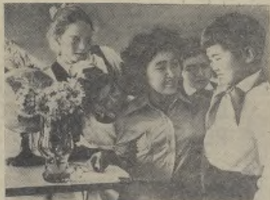
Советская власть дала женщинам Эвенкии возможность стать полноправными членами социалистического общества. Сегодня эвенкийки — это передовые труженицы сельского хозяйства, народного образования, медицины, советские и партийные работники.

За успехи в коммунистическом строительстве и выполнении народнохозяйственных планов Эвенкийский национальный округ награжден орденами Трудового Красного Знамени и Дружбы народов.