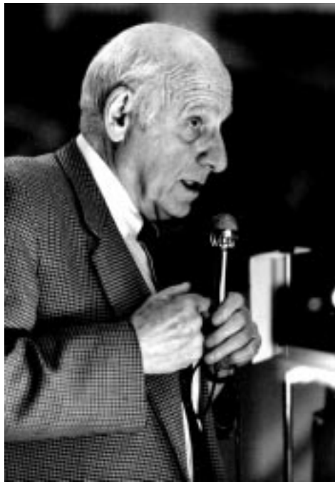
Академик А.П. Лисицын