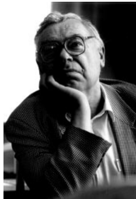
Академик Г.С. Голицын