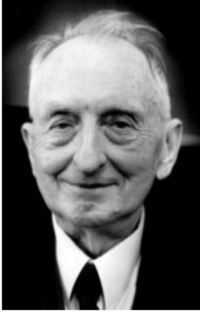
Директору Института общей физики РАН члену-корреспонденту РАН И.А. Щербакосу