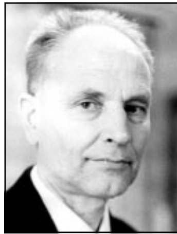
ПАТРИАРХ УРАЛЬСКОЙ ГЕОЛОГИИ