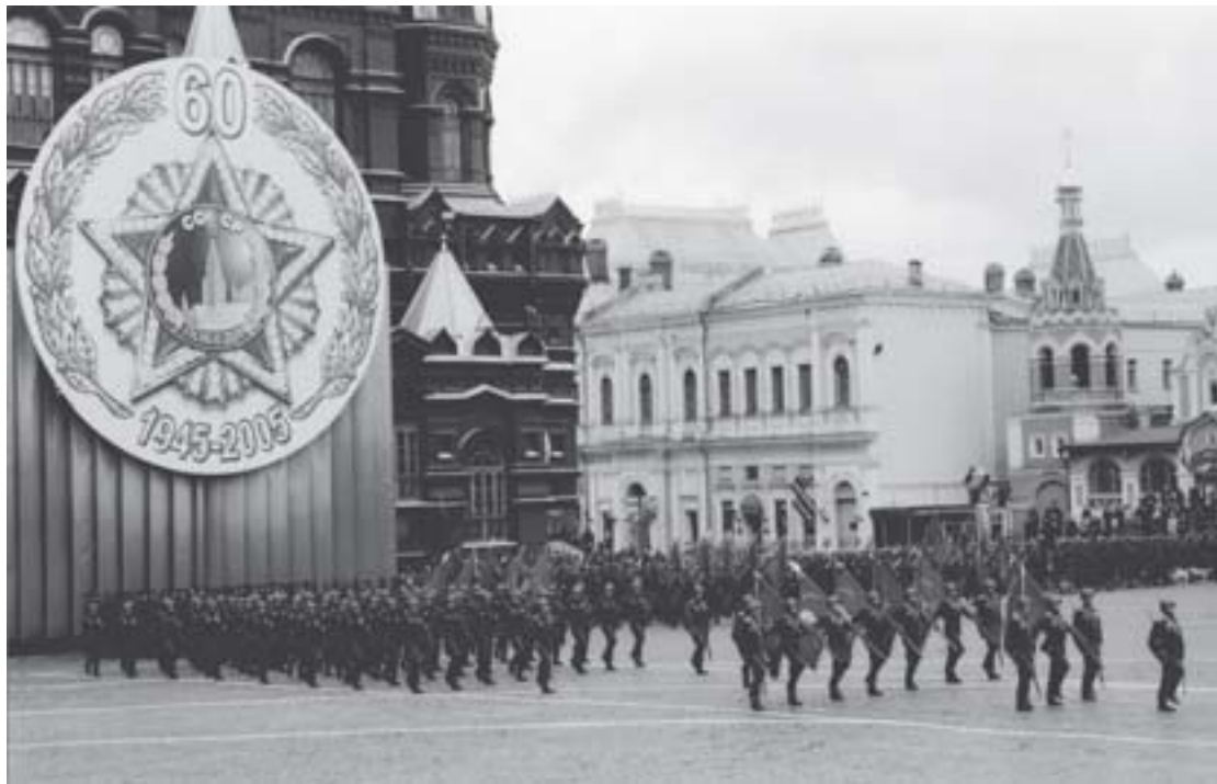
Юбилейный парад Победы 2005 года.