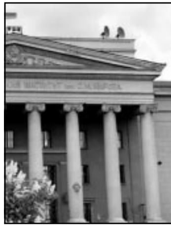
Фото С. НОВИКОВА Окончание на стр. 2

Следующим пунктом было обсуждение результатов плановой комплексной проверки научной, научно-организационной и финансово-хозяйственной деятельности Института экономики УрО РАН за 1995 – 1999 гг. В этот период его сотрудниками получен ряд важных результатов. За создание системы мониторинга энергетической и экономической безопасности регионов России авторскому коллективу была присуждена премия Правительства России в области науки и техники за 1999 год. Исследования по бюджетной тематике сочетаются с прикладными темами. Институт выполняет работы по заказу различных министерств и ведомств РФ, административных областей, городов и муниципальных образований. За последние пять лет сотрудники института приняли участие в разработке более 50 законопроектов и иных нормативных правовых актов. В этот период в институте вышло более 60 монографий, 15 сборников материалов научно-практических конференций и других изданий. На Президиуме директору ИЭ члену-корреспонденту РАН А.И. Татаркину был задан вопрос: почему у института практически нет публикаций в зарубежных сборниках. Александр Иванович объяснил это прежде всего тем, что в экономических исследованиях часто содержатся закрытые сведения. Обсуждались на Президиуме и другие вопросы, в частности касающиеся кадрового состава института, направлений его научной деятельности, степени точности выдаваемых прогнозов экономического развития.