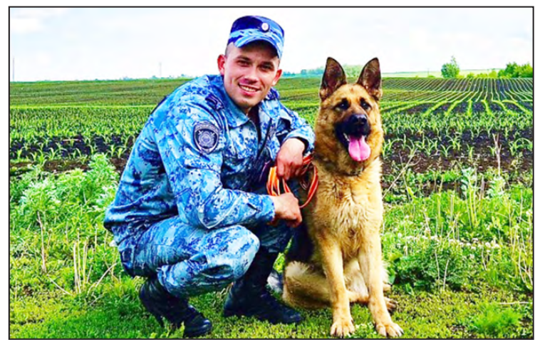
Верный пес на страже порядка

В ОМВД России «Артинский» на данный момент службу проходят три специалиста-кинолога: полицейский кинолог старший сержант полиции Алек-