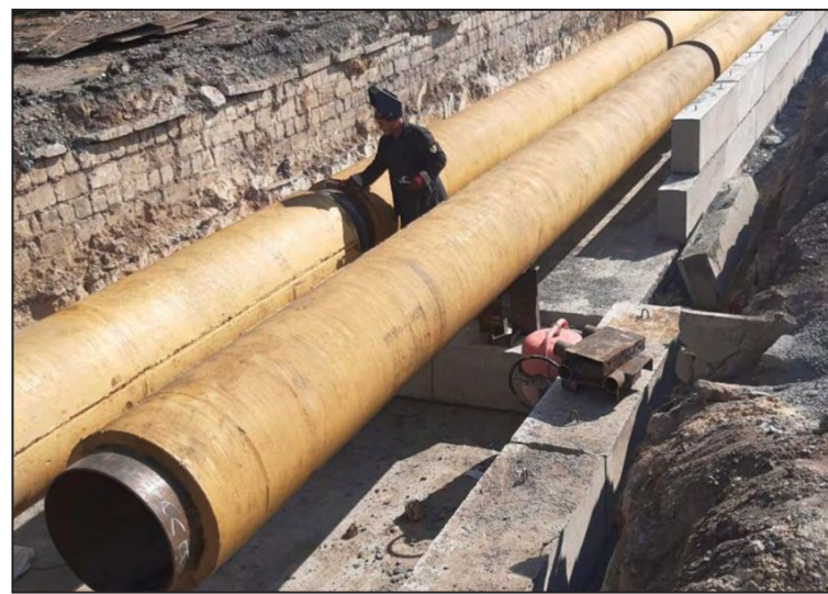
Подготовка к сезону 2024-2025 г. началась

В Артинском городском округе также началась подготовка к следующему отопительному сезону. Постановлением №272 от 15.05.2024 г. определены принципы готовности те-