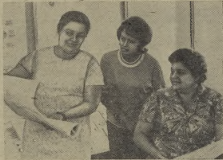
Днепропетровск. Пропагандисты Днепропетровского машиностроительного завода готовятся к началу учебного года в системе политического и экономического образования.

Во всех столицах союзных республик, в важных промышленных и культурных центрах страны «Известия» представлены собственными корреспондентами. Газета имеет своих постоянных корреспондентов в столицах большинства крупных зарубежных государств.