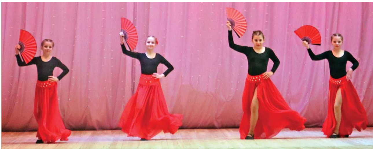
Юные Кармэн – будущее коллектива.