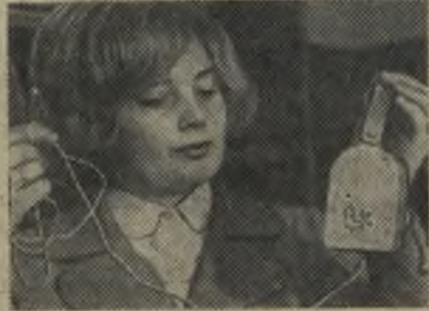
РЕДАКТОР В. В. ЕЛОВСКИХ.