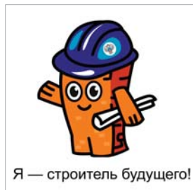
Я — строитель будущего!

На вопросы победителей конкурса ответят председатель общественного совета при министре России Сергей Степашин и глава Минстроя России Ирек Файзуллин. Текстовые и видеовопросы принимаются от участников с 6 до 14 лет. Цель конкурса – популяри-