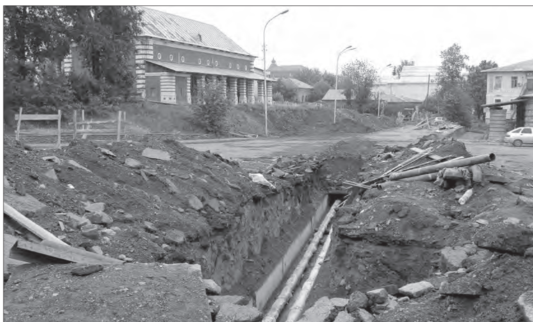
На время ремонтных работ улица Уральская стала похожа на поле боя.