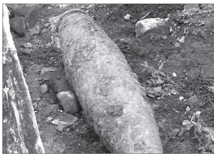
Старый, ржавый снаряд внешне выглядит угрожающе.

Как рассказал мастер строительно-монтажного управления №1 Марат Ажибеков, сотрудники предприятия проводили замену теплотрассы уже не первый день. Накануне с помощью экскаватора трассу раскопали, заменили все трубы, закрыли теплотрассу бетонными плитами, восстановили планировку участка.