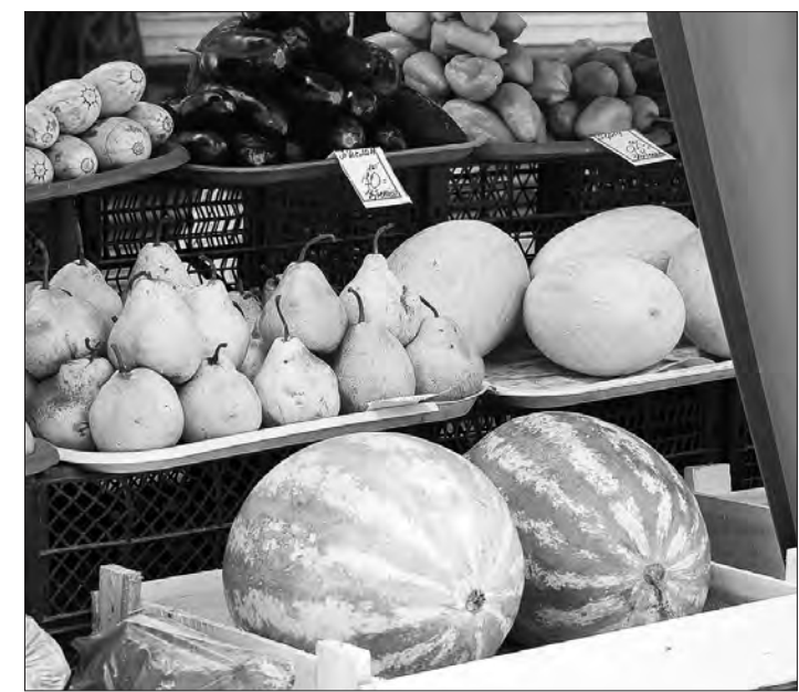
Выбор арбузов пока невелик...