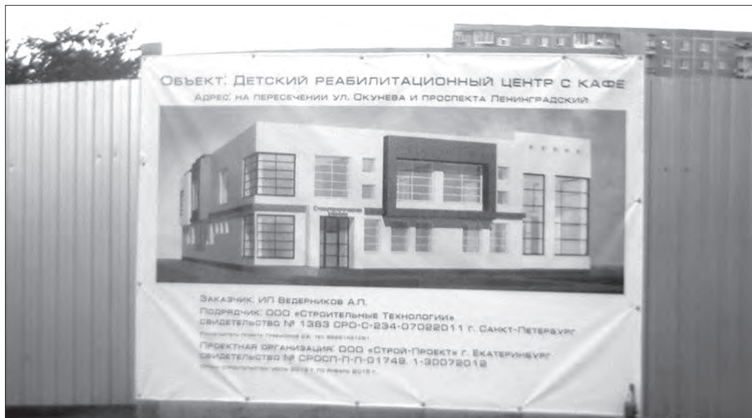
Фото автора с балкона ближайшей 9-этажки.

Вопрос мы переадресовали в управление архитектуры и градостроительства, где одна из специалистов