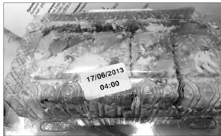
Злополучное пирожное.

«Возможно, что-то напутали на производстве, нарушили технологию приготовления, может быть, продукт неправильно хранился», - прокомментировала ситуацию ведущий специалист-эксперт Ирина Олеговна Кузьмина. «Вполне вероятно, что или производитель, или продавец «играет» с датами выпуска продукции. Это когда продукт изготовлен, к примеру, 15-го числа текущего месяца, а на него ставят 17-е число, таким образом искусственно наращивается срок хранения. Так нередко поступают непорядочные производители. Однако доказать подмену даты изготовления очень сложно. Да и проверки надзорных ведомств, по закону, могут проводить теперь раз в три года. Раньше они проводились ежемесячно. Сейчас нужно быть предельно внимательными при выборе продуктов».