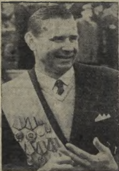
На снимке: Л. И. Яшин.

Сегодня в составе сборной клубов «Динамо» на футбольное поле Центрального стадиона имени В. И. Ленина в Москве в последний раз выйдет прославленный вратарь Лев Яшин. Прощальный матч с командой «звезд — сборной мира — признание его заслуг перед мировым футболом.