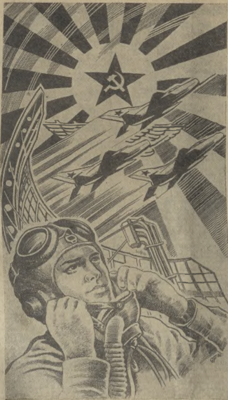
На страже мирного неба. Рисунок художника С. Андреева.

Конечной целью профсоюзных организаций должно стать достижение такого положения, чтобы каждый рабочий и служащий ревностно относился к производству, не терял зря ни одной рабочей минуты, был морально чистым во всех отношениях.