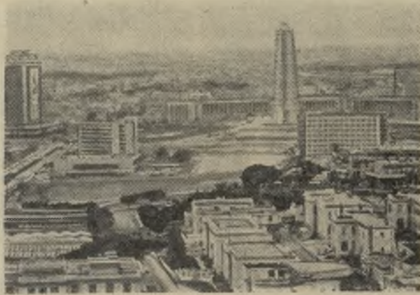
На снимке: столица республики Куба — Гавана. На втором плане — площадь революции имени Хосе Марти.

1 ЯНВАРЯ. ДЕНЬ ОСВОБОЖДЕНИЯ РЕСПУБЛИКИ КУБА.