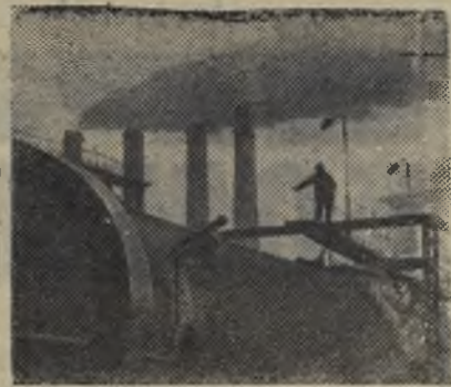
г. Михайловка (Волгоградская область). На снимке — фрагмент Себряковского цементного завода имени П. А. Юдина.