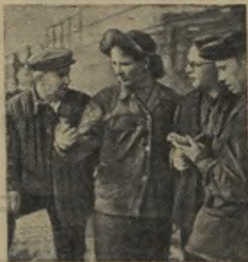
Загорелись электрические огни еще в одном цехе Иркутского алюминиевого завода.

Строго выполнять его требования — обязанность каждого коммуниста.