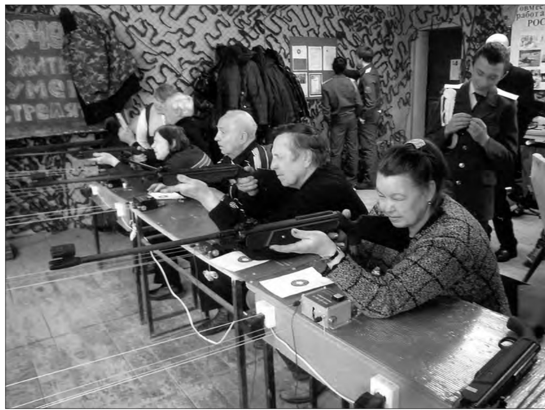
Команда ветеранов Ленинского района.

Между командами ветеранов Ленинского района и кадетов СОШ №21 состоялся соревнования по стрельбе, которые традиционно проводятся в честь Дня защитника Отечества.