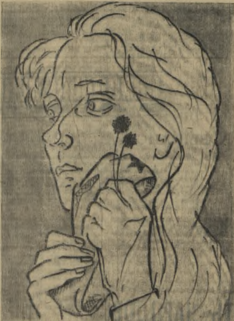
НИКТО НЕ ЗАБЫТ, И НИЧТО НЕ ЗАБЫТО

Победа Советского Союза над фашистской Германией и ее союзниками была одержана совместными усилиями государств и народов антигитлеровской коалиции. Советские люди по справедливости оценивают значение усилий и других свободолюбивых народов. В то же время все прогрессивное человечество знает, помнит и никогда не забудет, что именно Советский Союз сыграл решающую роль в