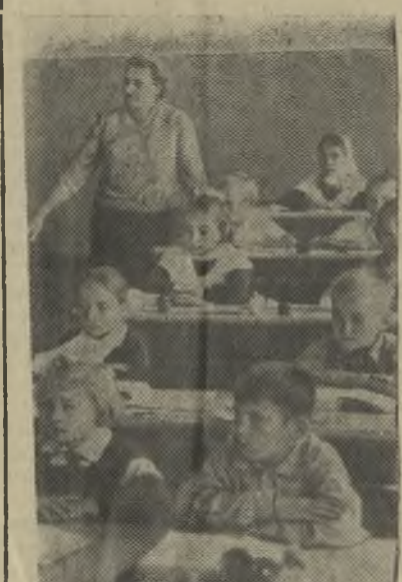
Волгоградская область. Хороший подарок получили в этом году дети труженников колхоза «Путь Ильича» Новоаннинского района. В станице Староаннинской для них построено новое здание школы.