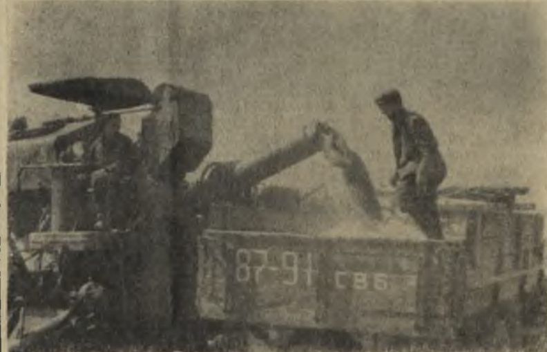
с. Останино.

ходит к другому комбайну. Шофер берет обмолоченные колосья, внимательно рассматривает их.