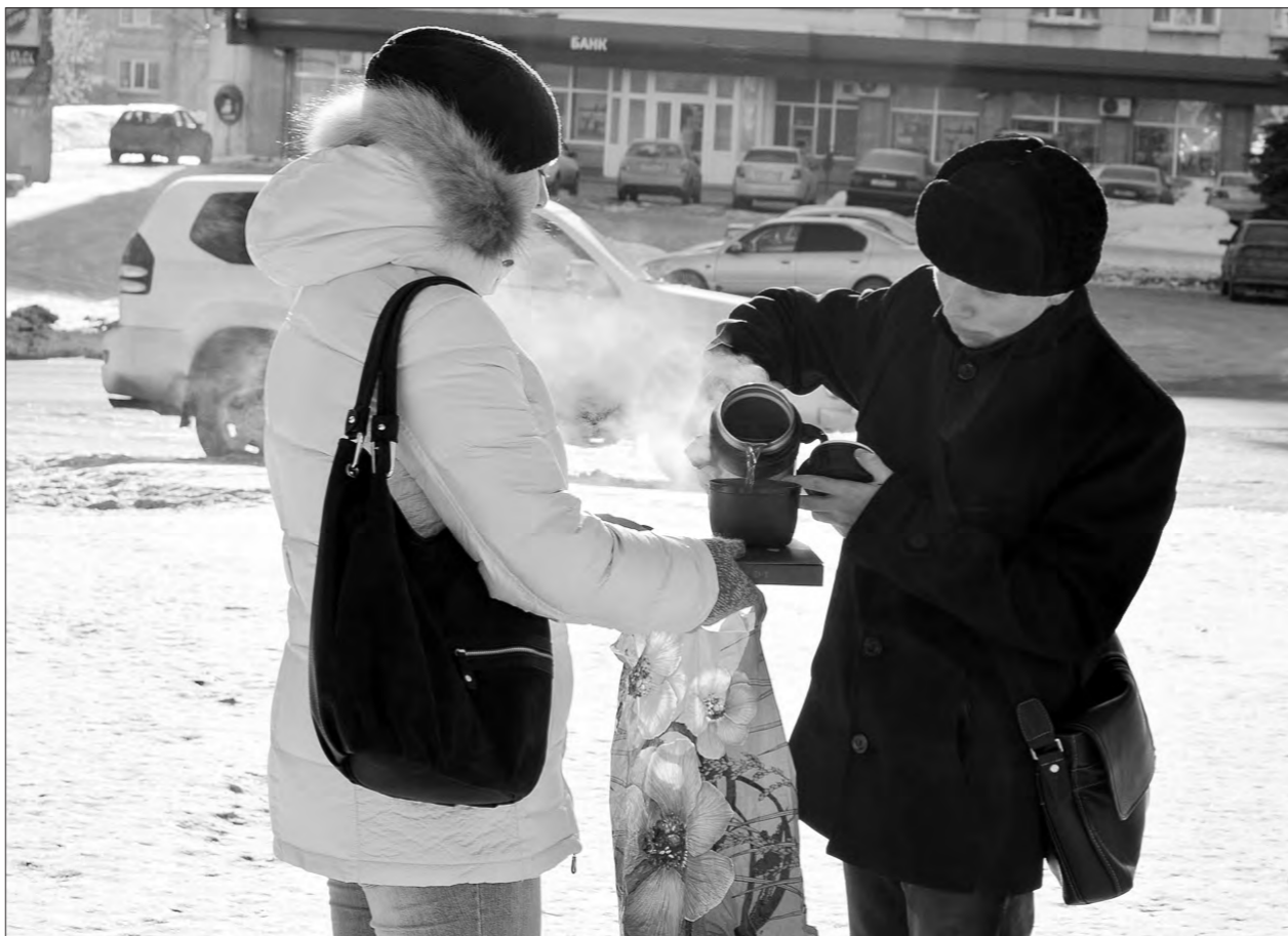
Согреться помогает чай из термоса.