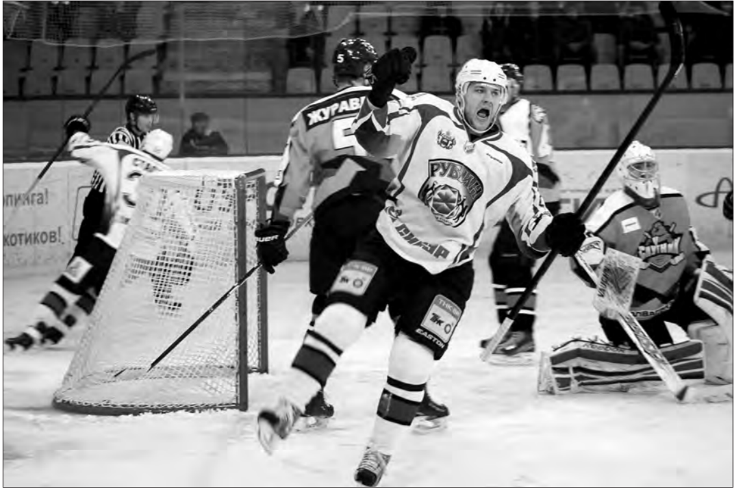
Радость тюменцев была недолгой, «Спутник» одержал уверенную победу.

В преддверии плей-офф «Спутник» проверил свои силы в матче с одним из лидеров ВХЛ – тюменским «Рубином». Финалист прошлого сезона был повержен со счетом 5:2. Напомним, в сентябре тагильчане победили в Тюмени в серии буллитов – 4:3.