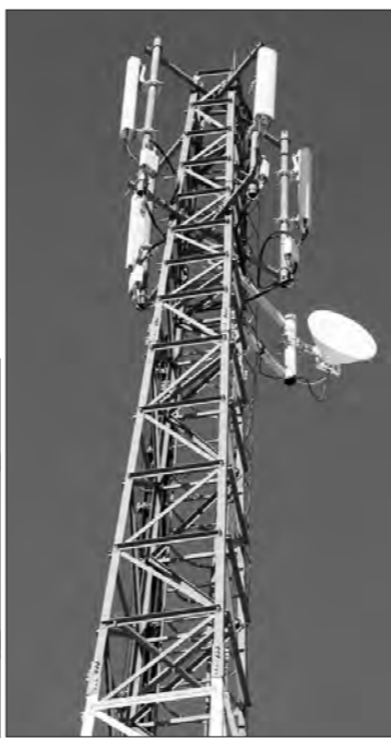
Базовая станция имени Мирона Черепанова. Ее высота 40 метров.