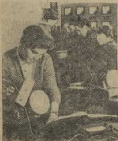
Пермь. Максимально приблизить обучение к условиям современной организации производства в промышленности и сельском хозяйстве стремятся преподаватели технического училища № 5, готовящего радиомехаников и электромонтеров широкого профиля. Здесь разработан перспективный план совершенствования учебно-производственного процесса. Созданы образцовые электротехническая и радиоизмерительная лаборатории.

Защитники капиталистического строя надеются, что коммунизм не в состоянии будет решить задачу воспитания нового человека. Они утверждают, что человек по природе своей существо порочное, а по