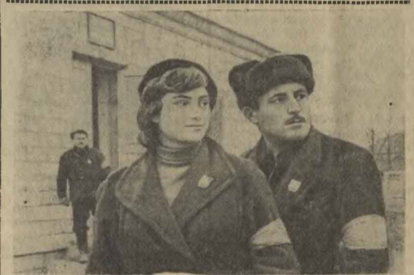
Дагестанская АССР. Совхоз имени Алиева Дербентского района — передовое хозяйство. Ему первому в республике присвоено звание коллектива коммунистического труда.

В поселке совхоза решили отказаться от услуг милиции. Охрану общественного порядка здесь ведет добровольная комсомольско-молодежная дружина.