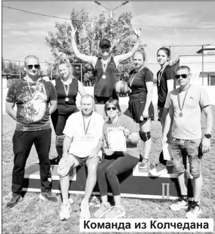
Команда из Колчедана

13 августа на стадионе Мартюша прошел большой районный спортивный праздник.