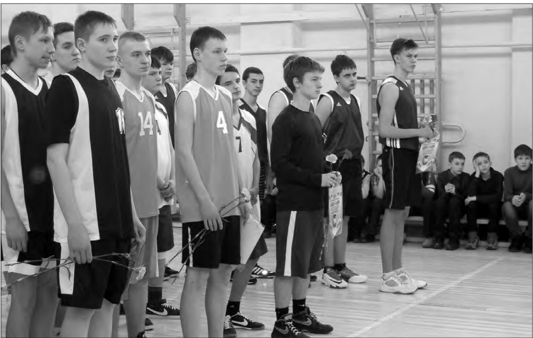
Баскетболисты отдали дань памяти и уважения россиянам, погибшим при исполнении служебного долга за пределами Отечества. Их мужество, героизм служат примером для будущих защитников Родины.