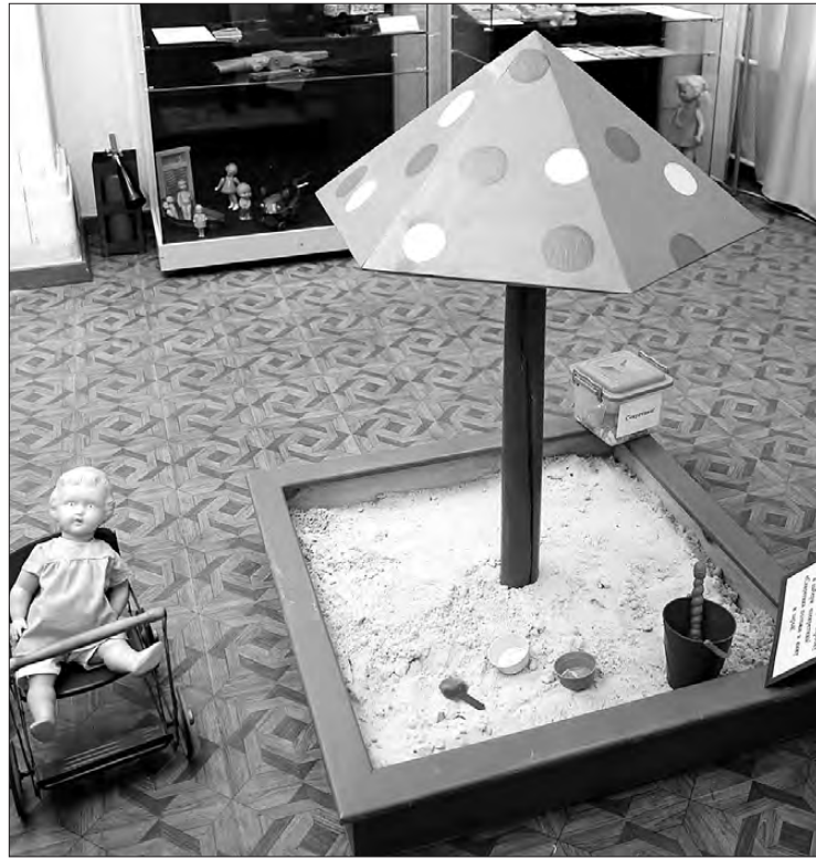
Настоящая песочница, в которой можно спрятать «секретик».

Прошло всего 14 лет, а словосочетание «прошлый век» уже прочно закрепилось за XX веком. Он стал историей. А вот какой именно, далекой и подзабытой или родной и любимой, каждый сам поймет, побывав в выставочных залах Нижнетагильского музея-заповедника на выставке «Сокровища детства» (0+).