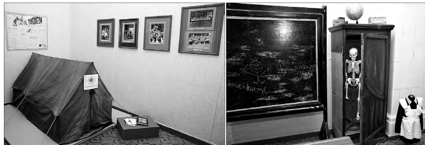
Палатка – символ пионерских походов.