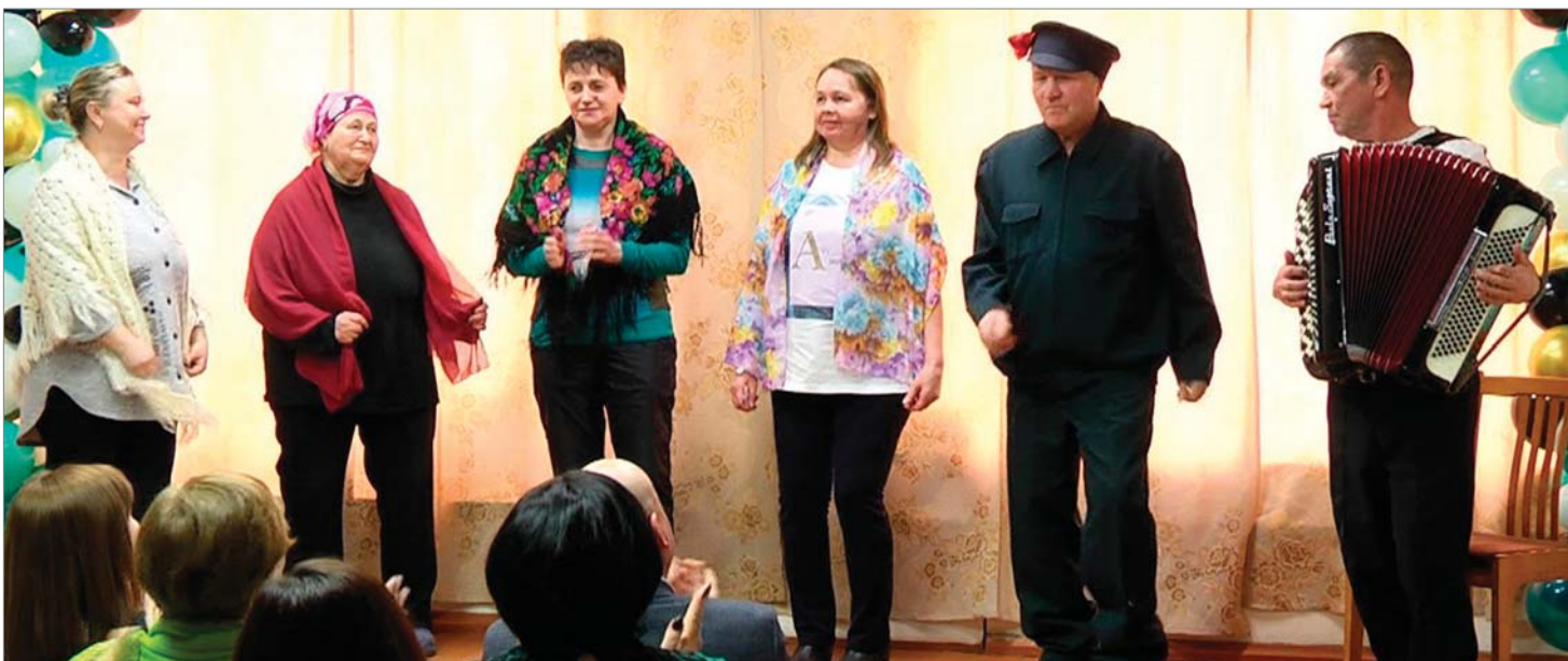
Выступает коллектив жилищно-эксплуатационного участка №1.