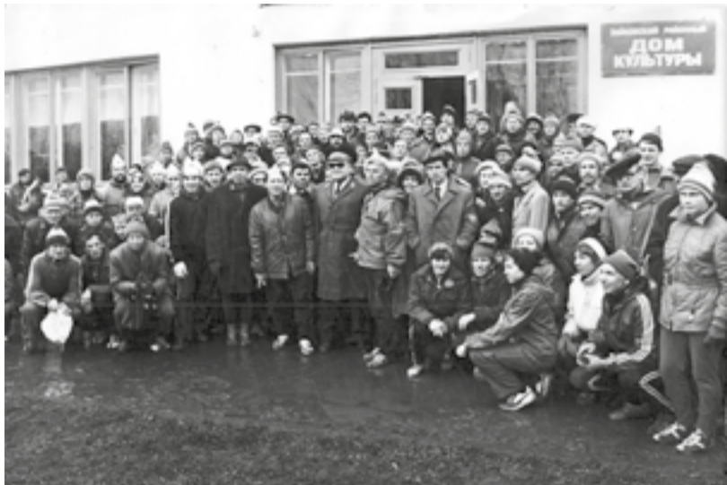
Дважды Герой Советского Союза Г.А. Речкалов среди участников легкоатлетического пробега Зайково-Ирбит. 1984 год. Пос. Зайково. Фотография.

г. Ирбите хранятся документы и фотографии, запечатлевшие историю легкоатлетического пробега имени дважды Героя Советского Союза Г.А. Речкалова, начало которому положено в далеком 1977 году.