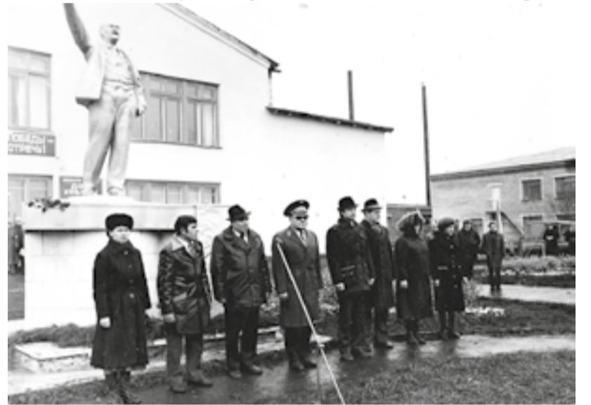
Приветствие участников 8-го легкоатлетического пробега Зайково-Ирбит на приз дважды Героя Советского Союза Г.А. Речкалова. 7 октября 1984 года. Пос. Зайково. Фотография.

Из-за плохой погоды старт решили перенести прямо на шоссе Ирбит-Камышлов. Здесь возле километрового столба с цифрой 21 дана сигнальная ракета, отправившая в путь 61 участника пробега. Спортсмены двигались по Камышловскому тракту в направлении г. Ирбита, где финишировали на