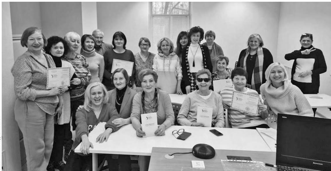
На курсах слушатели не только пополнили багаж знаний, но и нашли новых друзей.

—Теперь ты в нашем распоряжении! — обрадовались дети и внуки.