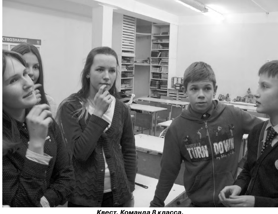
Квест. Команда 8 класса.

Одни газету о праве создавали, другие - с младшими школьниками беседы проводили. Конечно, мы выиграли, ещё и призы порадовали. Спасибо нашим партнёрам.