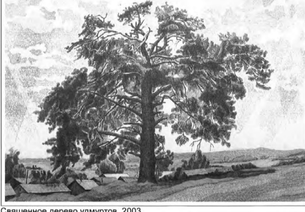
Священное дерево удмуртов. 2003.