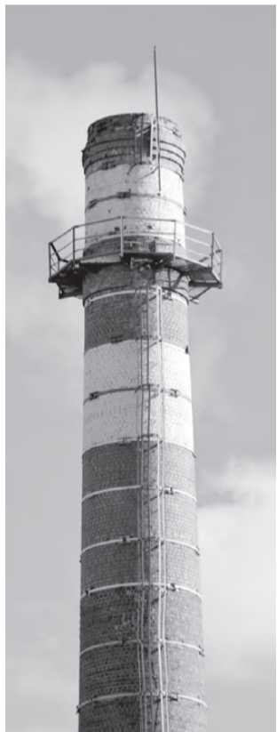
Несмотря на тяжёлую ситуацию с зарплатой, работники котельной не прекращают обеспечивать микрорайон теплом и горячей водой.

В прокуратуре пояснили, что на сегодняшний день заключён договор переуступки долга с бюджетными организациями, это позволит напрямую перечислять деньги на расчётный счёт котельной №1 и ускорит выплату заработной платы. Но, по предварительным данным, средства поступают только в конце месяца.