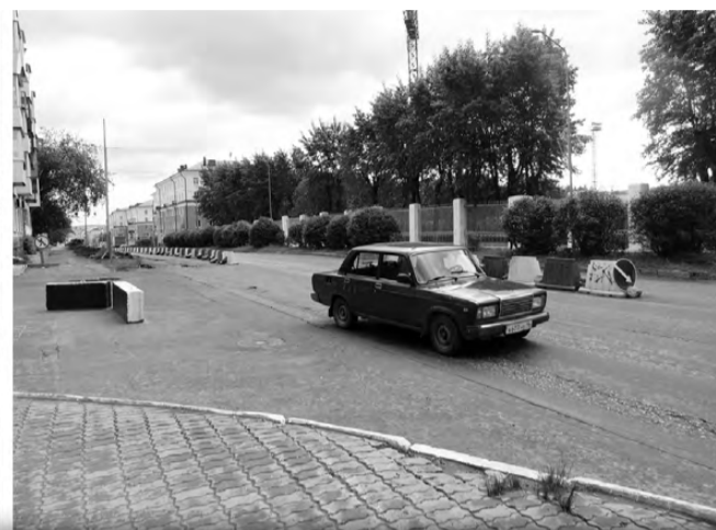
СХЕМА ДВИЖЕНИЯ ПО ПРОСПЕКТУ ИЛЬИЧА