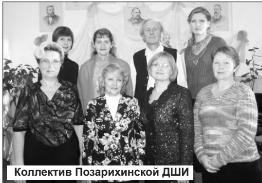
Коллектив Позарихинской ДШИ