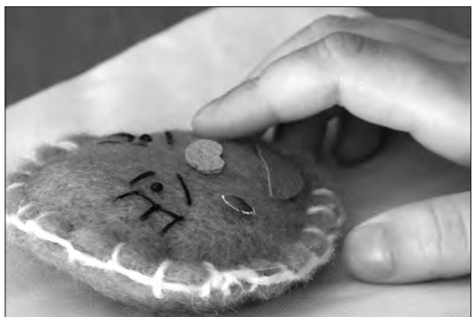
сделать своими руками тактильную сказку для нуждающегося в ней ребенка. За подробной информацией обращайтесь в библиотеки города.

А мы напоминаем нашим читателям, что каждый тагильчанин может принять участие в акции «Особым детям – особые книги» и