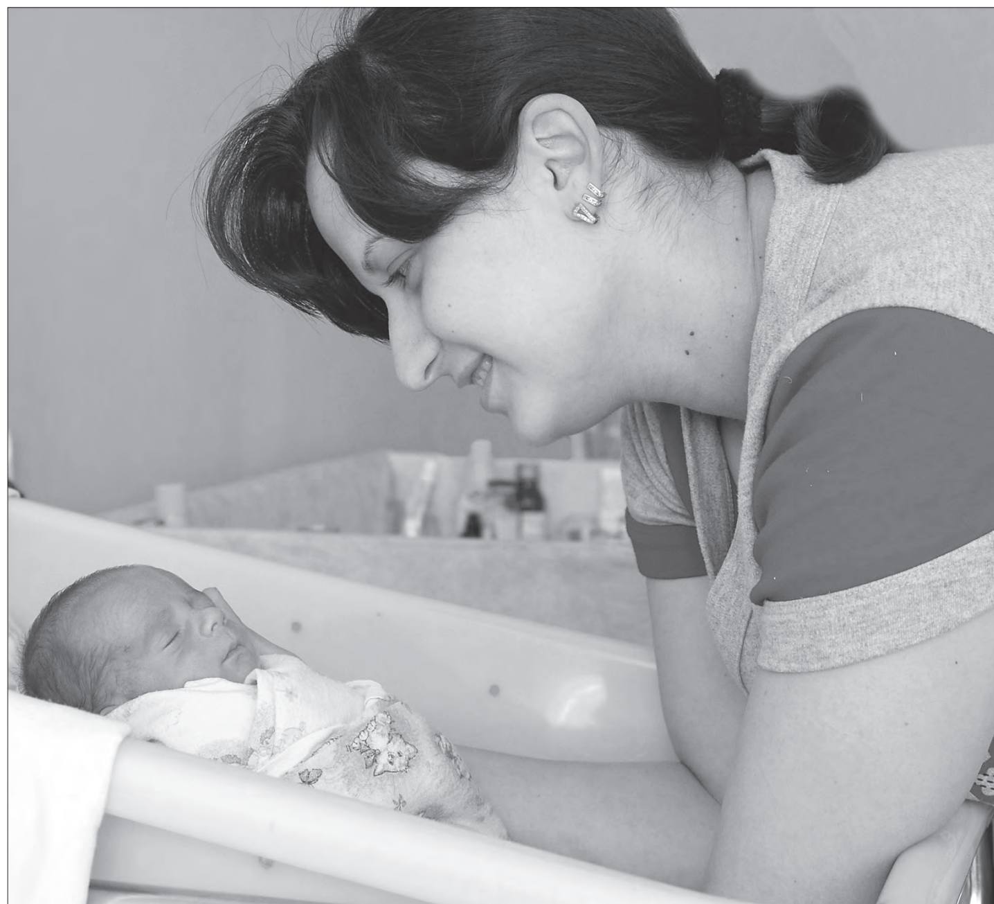
В отделении новорожденных детей.