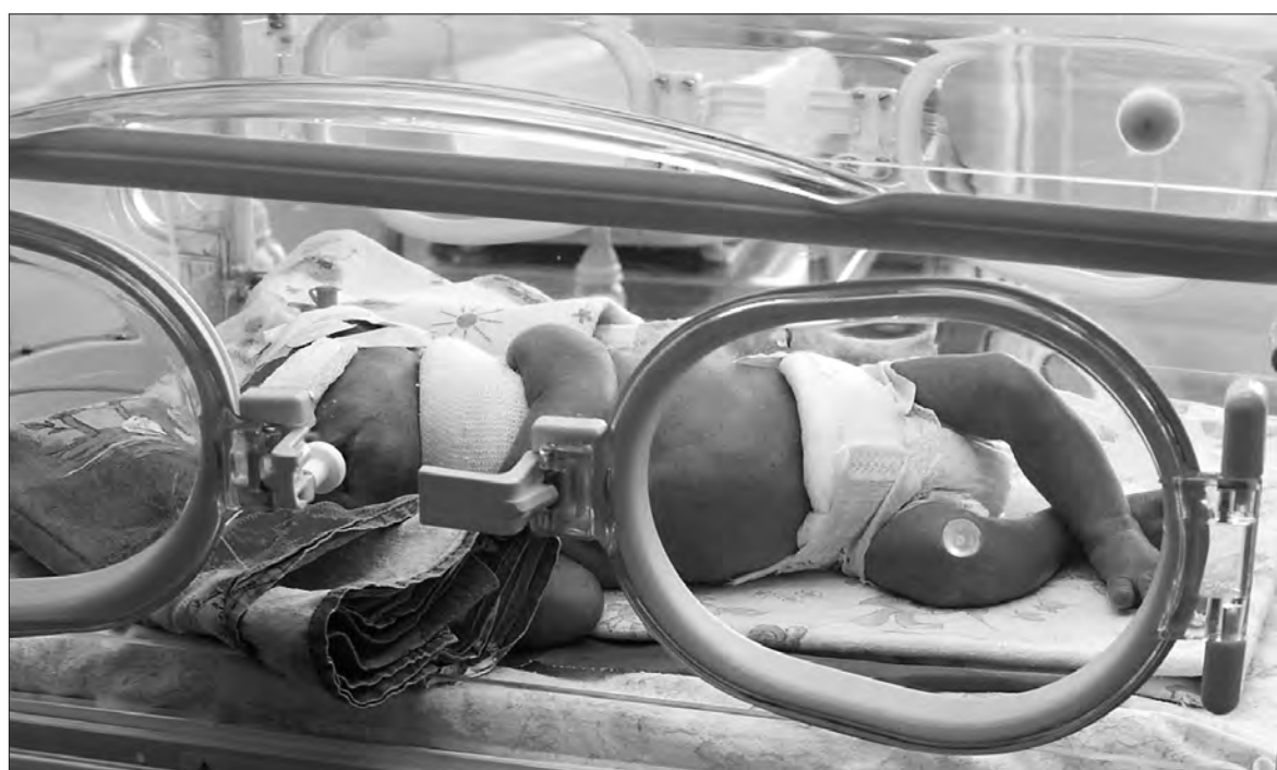
Кювезы, где все: от показателей влажности до температуры, как у мамы.