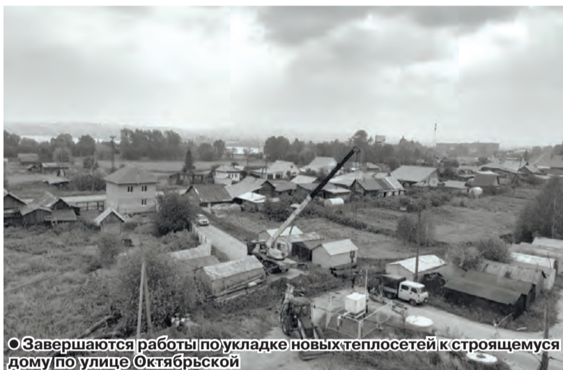
○ Завершаются работы по укладке новых теплосетей к строящемуся дому по улице Октябрьской

В Бисерти уже появились первые, едва уловимые, предвестники зимы, свидетельствующие о том, что лето неумолимо клонится к закату.