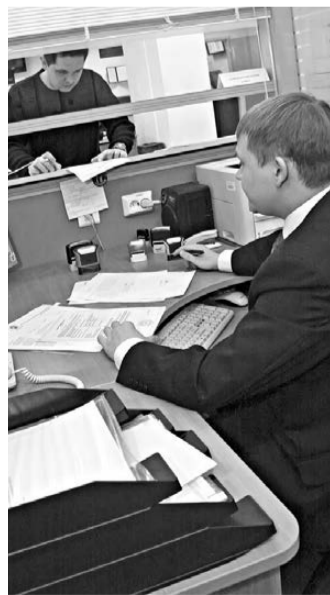
27 октября работники налоговых инспекций выслушают все жалобы посетителей.