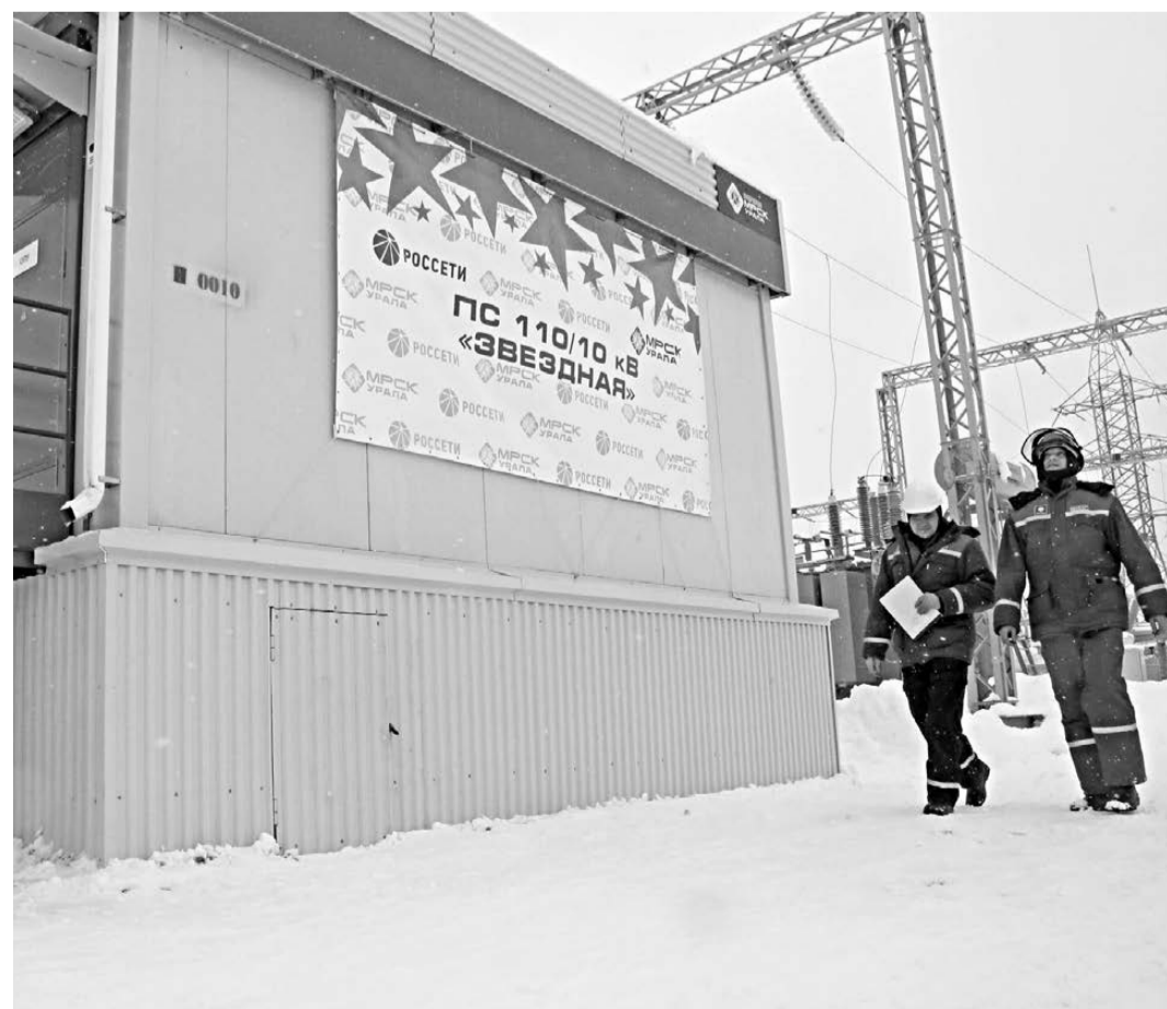
Ввод новой подстанции позволит беспрепятственно подключить к сетям новые производственные объекты.