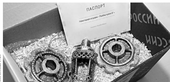
Посылка с необычными игрушками отправилась в Великий Устюг, в музей Деда Мороза.

Посылка с металлургическими елочными игрушками уже отправлена в Великий Устюг, в музей Деда Мороза, остальные наборы будут подарены друзьям завода. По словам мастеров, они бы и сами с удовольствием украсили оригинальными изделиями свои домашние елки, но сделать партию больше пока нет возможности. Станки постоянно заняты основным производством.