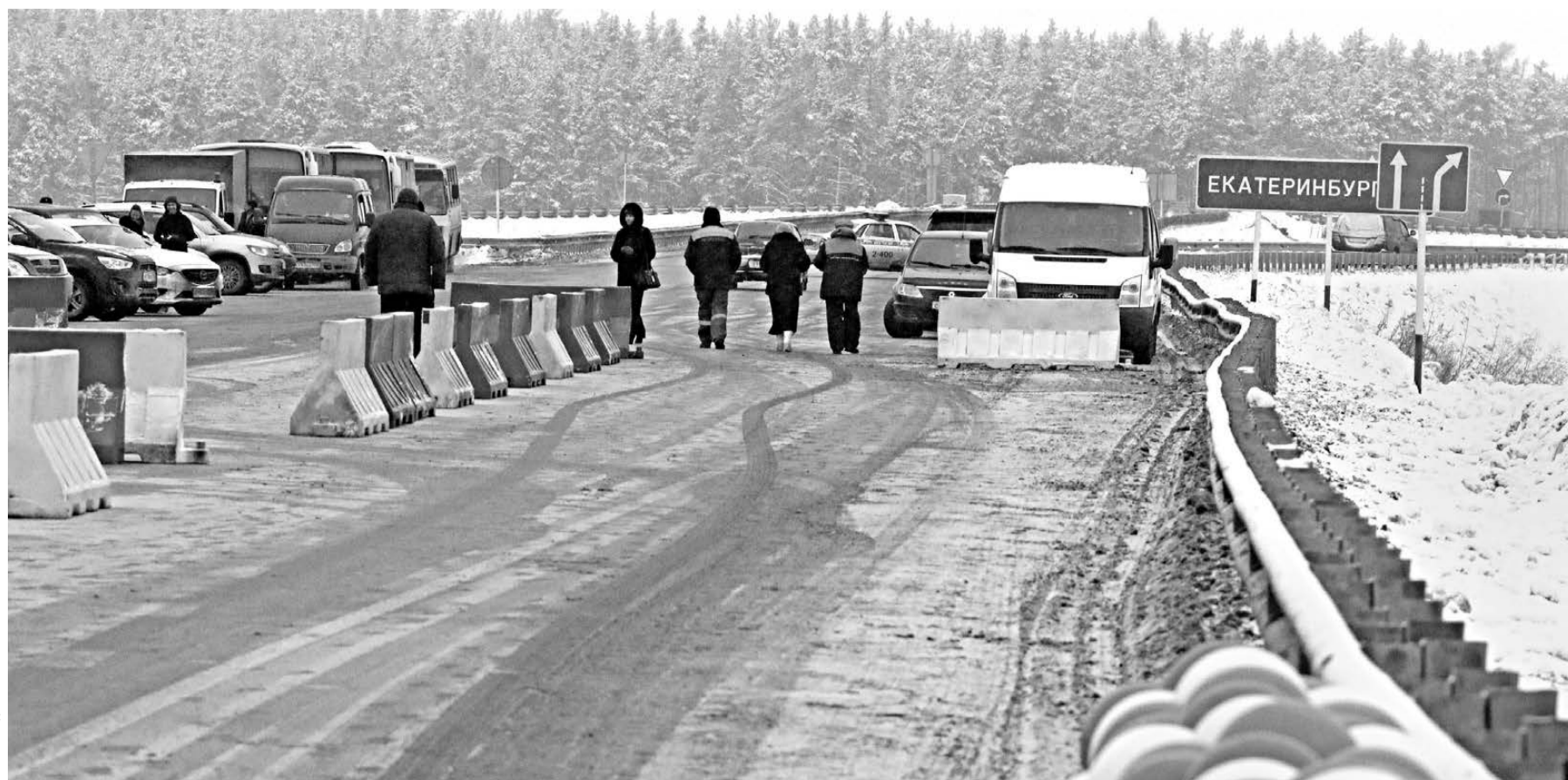
Ввод в эксплуатацию без малого 10-километрового участка Екатеринбургской кольцевой автодороги (ЕКАД), соединившего Новомосковский тракт с подъездом к поселку Медному, стал хорошим подарком всем жителям Свердловской области к Новому году. Строительство ЕКАД началось в 1994 году. Общая протяженность дороги составит 94,38 километра. Пять из шести участков протяженностью 58,7 километра были введены в эксплуатацию в период с 1997 по 2011 годы. Последний участок ЕКАД (35 километров) начали возводить четыре года назад. Строительство первого пускового комплекса Южного полукольца удалось завершить досрочно, в том числе благодаря привлечению федеральных средств — более 1,5 миллиарда рублей.