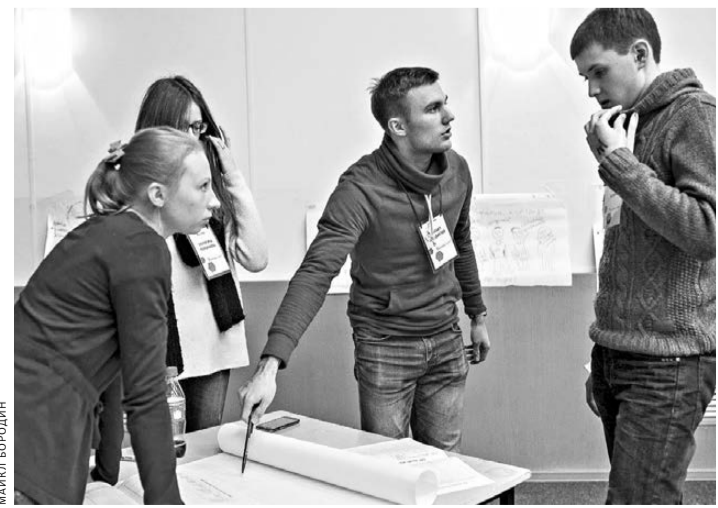
Заключительный четырехдневный интенсив — это жаркие споры внутри команды и отстаивание своих идей перед экспертами.

А в виде образовательной программы эта ориентированная на практику стратегия должна стать неотъемлемой частью высшего образования. Ведь ребята, один раз «нырнувшие» в бизнес, как настоящие дайверы, навсегда забывают страсть к этому миру: они обретают не только алгоритмы решения предпринимательских задач, но и особый стиль мышления, позволяющий им добиваться успеха, даже если с первого раза не все пошло гладко.