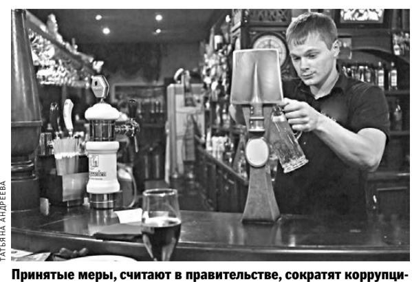
Принятые меры, считают в правительстве, сократят коррупционный поток от выдачи лицензий на спиртное.

Как сообщили в Росалкогольрегулировании (РАР), минимальная розничная цена на водку будет снижена с 1 февраля 2015 года с 220 рублей до 185 за пол-литровую бутылку. Прежде РАР начиная с 2009 года лишь повышал значение этого инструмента контроля на алкогольном рынке. Напомним, в 2014 году повысились минимальные цены проводилось дважды: в марте и августе. Снижение произойдет впервые. Отпускная цена за водку у производителей снизится до 162 рублей со 171 рубля, оттокая — до 170 рублей со 179 рублей. Нижний порог по стоимости коньяка и бренди останется без изменений.