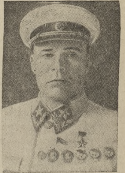
Народный комиссар обороны СССР Маршал Советского Союза Семён Константинович Тимошенко.