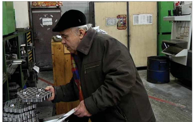
Лицевые для дырчатой насадки теперь делают на современных обрабатывающих центрах.

вано производство обечаек. По дороге заглядываем в термоотдел.