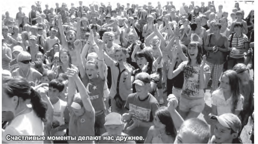
Счастливые моменты делают нас дружнее.

Этот же красненький блокнот сопровождал меня и на третьей смене. Третья смена, посвященная супергероям,