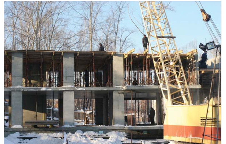
И в морозы строители продолжают поднимать этажи дома для заводчан.

Заглянули мы и на соседний объект, где должны возводиться дома по программе переселения первоуральцев из ветхого и аварийного жилья. Началась стройка бойко, а в минув-