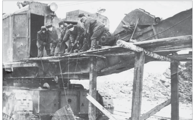
Бригада слесарей рудника ремонтирует экскаватор «Шкода».