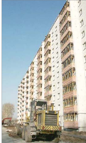
В 2006-м году была построена высотка по улице Ильича, 36.

- На заседаниях заводской жилищной комиссии решения о предоставлении служебных квартир принимаются путём голосования только после коллегиального обсуждения изложенных в заявлениях работников причин, послуживших основанием для обращения в жилищную комиссию, заслушивания руководителей цехов и служб, которые приходят на заседания и ходатайствуют за своих работников, заслушивания ходатайств от председателей цеховых профсоюзных комитетов. Причинами отказа в предоставлении работнику служебного жилья по договору коммерческого найма являются: трудовой стаж на заводе менее двух лет, семейное положение, то есть когда работник проживает один, без семьи, но главная причина отказа заключается в наличии у