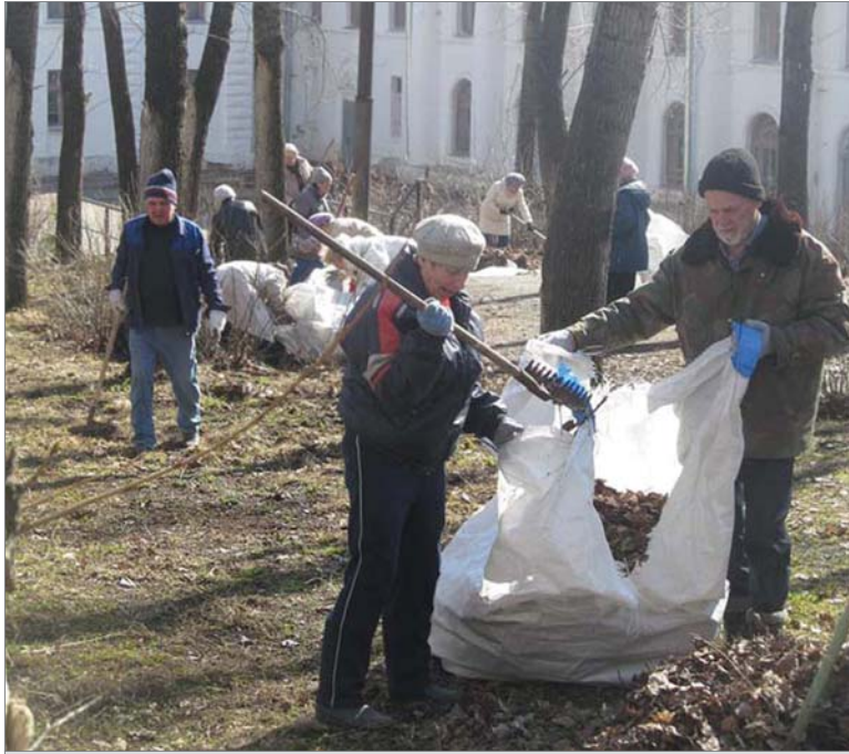
Весна - 2015. Динасовцы стараются прибрать каждый уголок в микрорайоне. Ветераны завода наводили порядок на территории парка за ДК «Огнеупорщик».

Предприниматели ежегодно убирают территорию вокруг своих торговых точек. Согласно постановлению администрации города, они обязаны расчистить зону в радиусе 5 метров. Но многие, как и сотрудники магазина