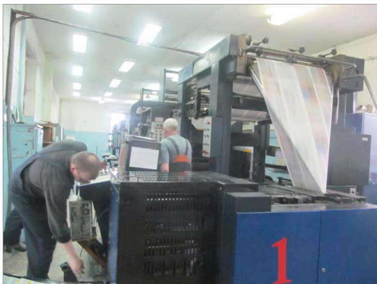
Бригада печатников контролирует процесс работы полноцветной машины.