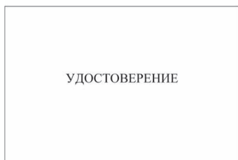
Внешняя сторона удостоверения