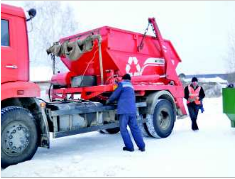
Три раза в неделю по графику из Кунары вывозят заполненные контейнеры.

В январе 2013 года в Москве прошел экмарафон, организованный Международной ассоциацией экологов "Глобал Эко Брэнд Терра Вива". Невьянский городской округ был награжден специальным дипломом и Почетным знаком ассоциации как единственный регион России, эффективно решивший проблему сбора и вывоза твердых бытовых отходов (ТБО) в сельской местности.