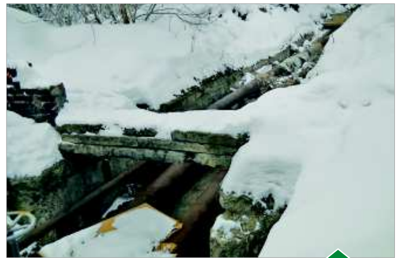
Теплотрасса в Корабельной роще уже сейчас готова к весеннему ремонтным работам.