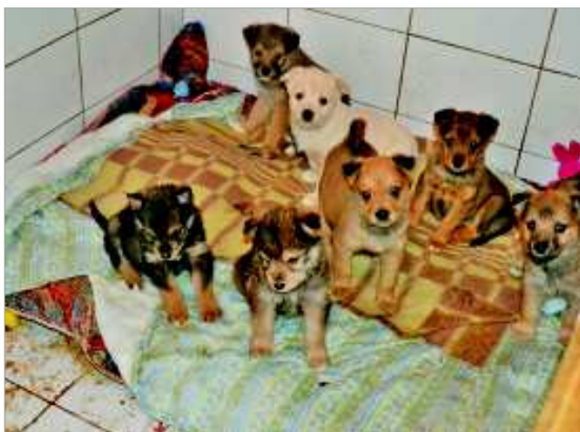
Щенки в приюте болеют и ждут лекарств...

Если вы переживаете за щенков и имеете возможность помочь, пожалуйста, поучаствуйте в их спасении. Медикаменты требуются СРОЧНО. Доп. информация по тел. 8-950-649-44-62, или пишите смс.