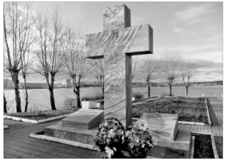
Мемориальный комплекс на месте "Богословлага".