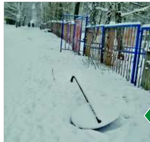
На этот дорожный знак у школы № 10 автомобилисты перестали обращать внимание. Его просто нет.