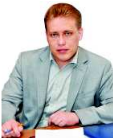
Продолжаем публикацию ответов главы ГО Юрия ПЕРЕВЕРЗЕВА на вопросы первоуральцев.

- Слышали, что закрывается детская библиотека на улице Ватутина, 36. Мы с сестрой еще в детстве ходили в эту библиотеку, а теперь туда ходят и мои дети. Считаю, что это прекрасное место для развития ребенка. Многие дети приходят сюда за книгами для подготовки школьных заданий и просто для полезного времяпрепровождения. Здесь проводят дополнительные образовательные занятия и самые разнообразные выставки. Детская библиотека - это особый мир для детей, который нельзя разрушать.