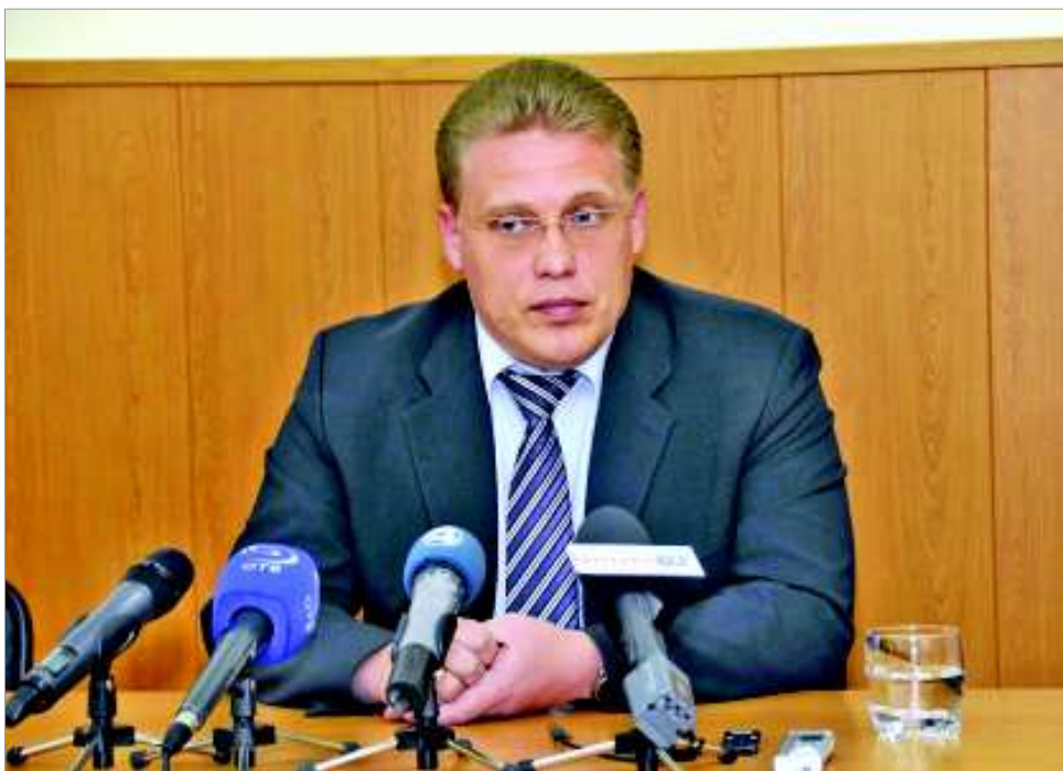
Юрий Олегович Переверзев, глава ГО Первоуральск.

мечено, состоится в конце февраля, как только город отчитается в Министерстве финансов области об исполнении бюджета за 2012 год.