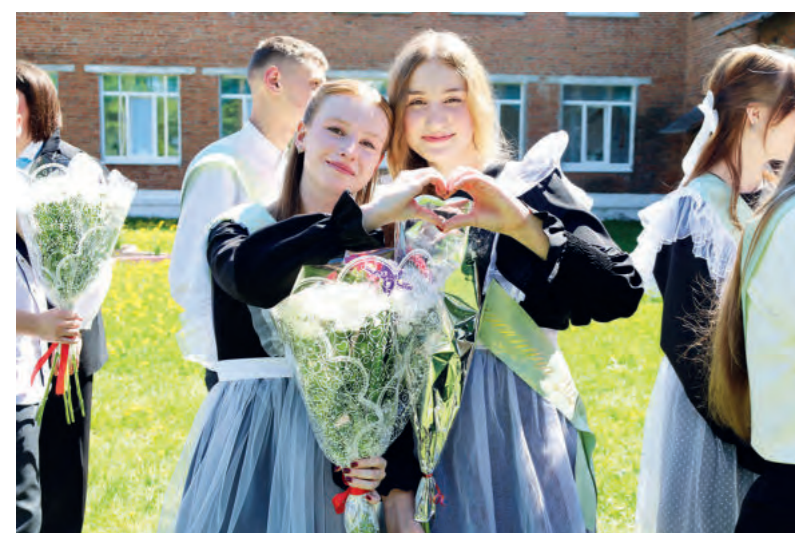
АНАСТАСИЯ МОХНАШИНА

Представители районной администрации, председатели территориальных администраций, общественных организаций, депутаты разного уровня в этот день разъехались по всем школам района, чтобы поздравить будущих выпускников. В Зайковской школе №1 к одиннадцатиклассникам, родителям