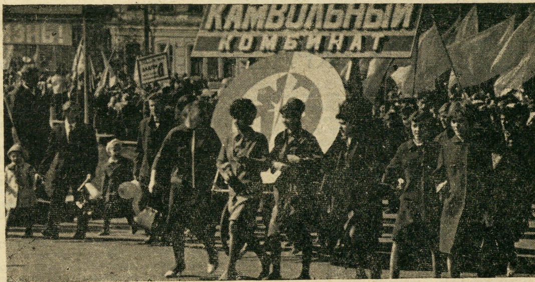
Трудящиеся камвольного комбината на первомайской демонстрации.