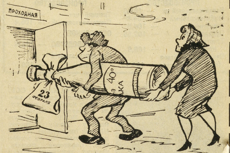
Рис. худож. Г. Костылева.

...Кончился рабочий день, и людской поток снова устремился через проходную. Люди спешат по своим делам: одних ждут домашние заботы,