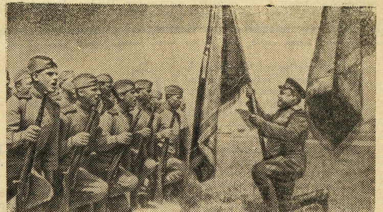
На снимке: воины у боевого знамени дают клятву биться с врагом до полной победы.