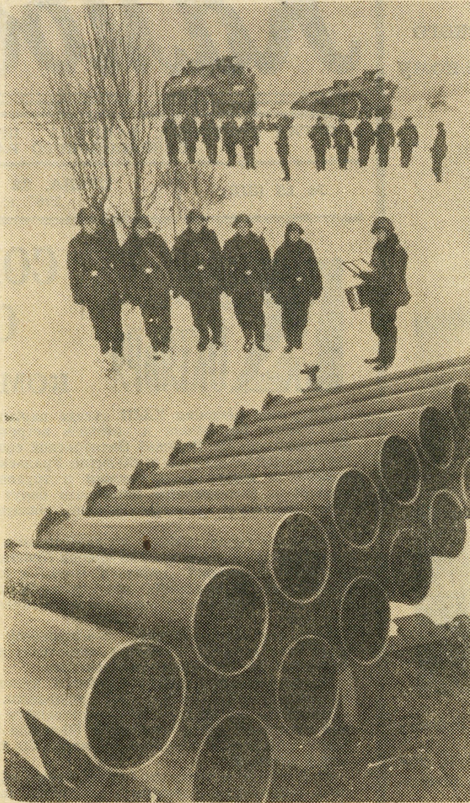
Артиллеристы на полевых занятиях.

Решениями XXIII съезда партии предусмотрено дальнейшее укрепление обороноспособности нашей страны. Советский народ может спокойно и уверенно трудиться: могучие Вооруженные Силы стоят на страже его мирного труда.