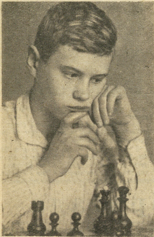
На фотоконкурс «ЮБИЛЕЙНЫЙ». Трудная партия.